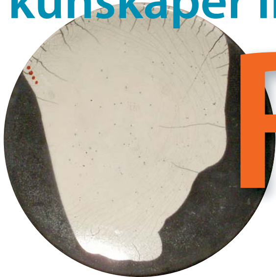
Raku betyder "lycka" eller "behag" och är en japansk bränningsteknik från tidigt 1500-tal.