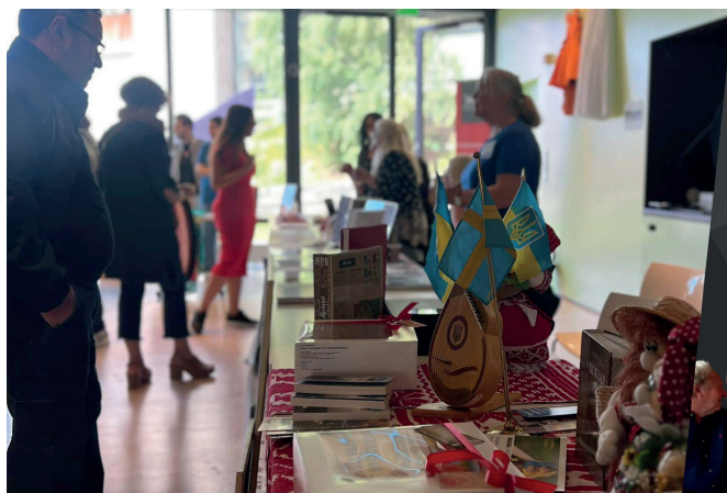
Inspirationsdag på Världskulturmuseet.