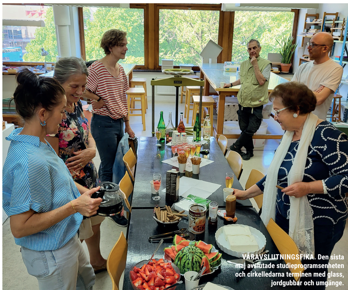
VÄRAVSLUTNINGSSFIKA. Den sista maj avslutade studieprogramsenheten och cirkelledarna terminen med glass, jordgubbar och umgänge.

”Lagom antal deltagare för att kunna få individuellt stöd för hinder jag stötte på. Lagom tempo och lyhörd ledare som anpassade tempo och nivå. Känner att jag utmanades och gavs tid för att lära mig och förstå.”