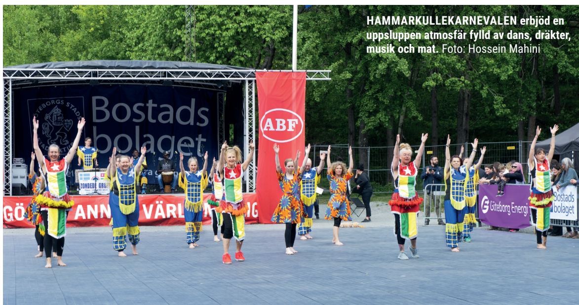
HAMMARKULLEKARNEVALEN erbjuder en uppsluppen atmosfär fylld av dans, dräkter, musik och mat.

Dessutom har föreläsningsserien, som är ett resultat av ett samarbete mellan ABF Göteborg, Folkets Hus Hammarkullen, Folkhögskolan i Angered och Mariakyrkan i Hammarkullen, fortsatt att dra stor publik med sina föreläsningar, hållna i Folkets Hus Hammarkullen. Föreläsningarna 2023 var: