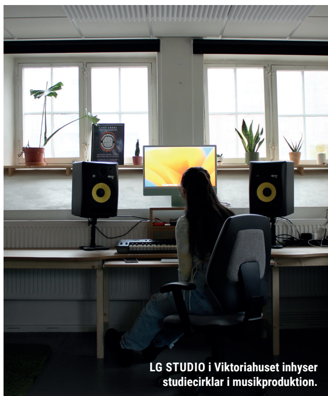
LG STUDIO i Viktoriahuset inhyser studiecirkel i musikproduktion.

I augusti anordnades en workshop i musikproduktion i studion som leddes av en deltagare i studion. Workshopen hade tio deltagare.