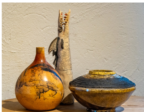
Keramik tillverkad av Lena Lidström, föreningen Lera & Mera

Intresset för våra konstutställningar är stort och lockar ca 600-700 besökare per utställning.