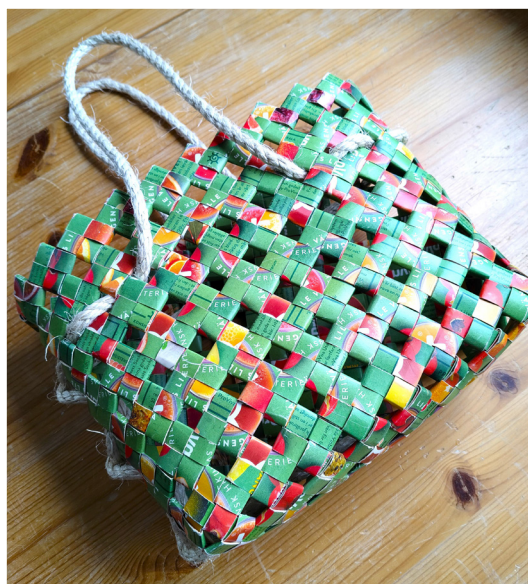
Väska tillverkad av återvunna Provivaförpackningar

Under året har vi genomfört 49 arrangemang inom dessa områden med totalt 1151 deltagare och en spridning över 18 olika platser i kommunen. Verksamheten har tagit sig olika former: studiecirklar, föreläsningar, kulturprogram och praktiska workshops.