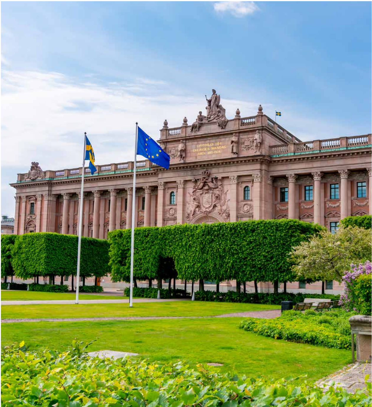
Riksdagshuset på Helgeandsholmen i Stockholm. Den svenska regeringen förankrar sin EU-politik i riksdagens EU-nämnd.

EU-nämnden ger regeringen mandat för vilken åsikt riksdagen anser att regeringen ska föra fram i EU-förhandlingarna på ministerråden. Regeringen måste ha mycket goda skäl om den inte följer det mandat den fått från EU-nämnden.