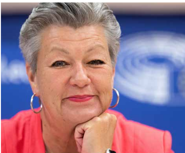
Den svenska EU-kommissionären Ylva Johansson.

De flesta beslut fattas med kvalificerad majoritet. Det betyder att inte alla länder behöver vara med på beslutet.