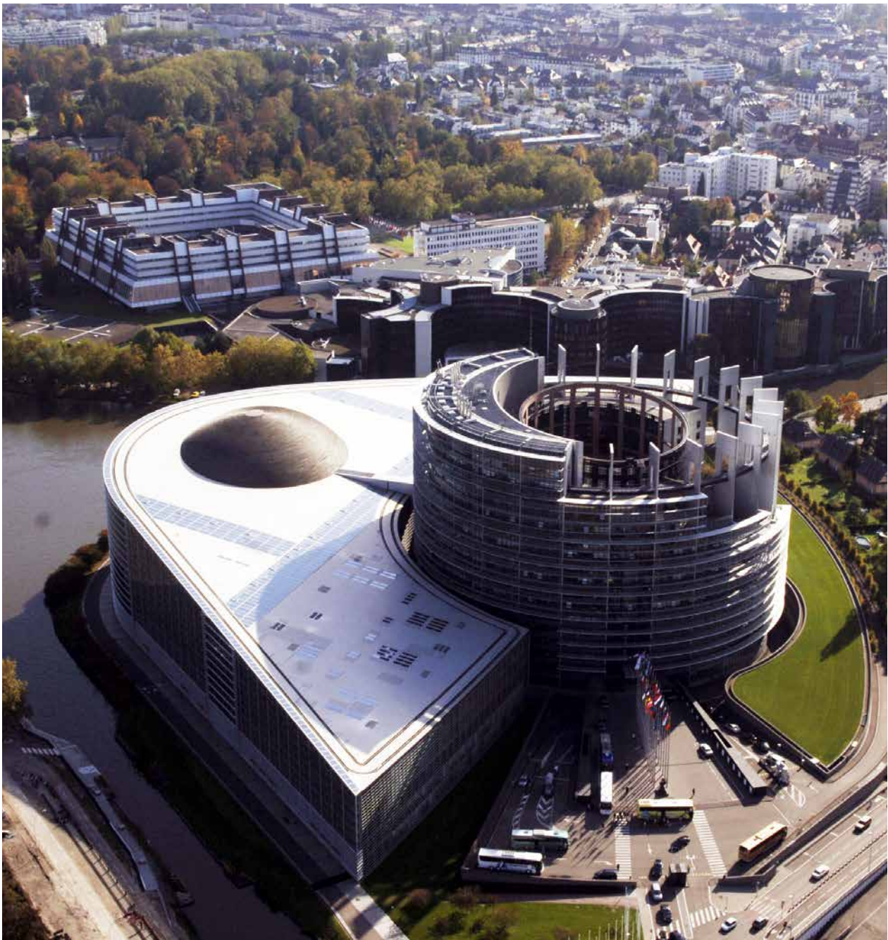
Europaparlamentets huvudbyggnad i Strasbourg. Parlamentet sammanträder 12 gånger per år i den franska staden Strasbourg i enlighet med Lissabonfördraget.