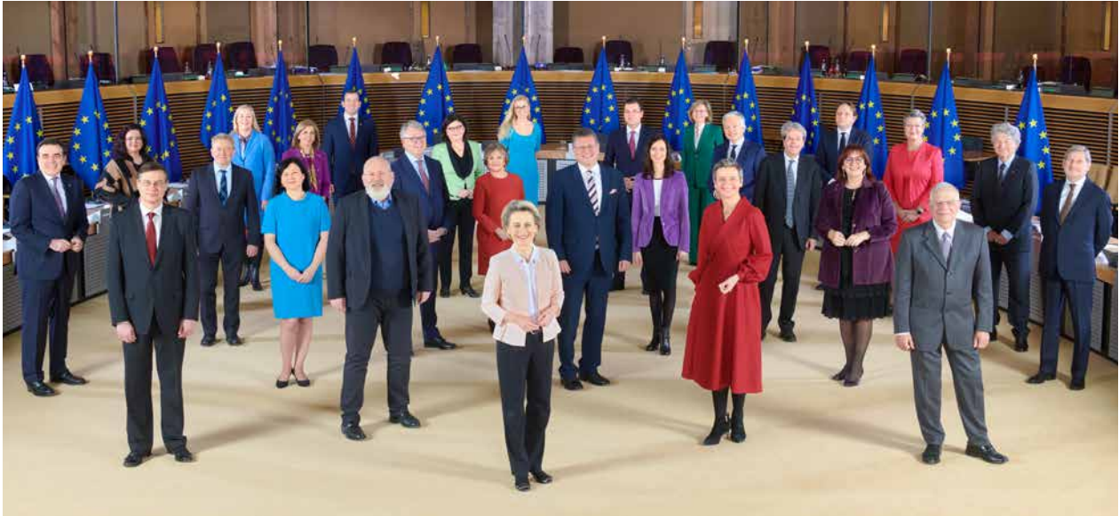
Ursula von der Leyen omgiven av EU-kommissionens övriga ledamöter, bl.a. vår svenska kommissionär Ylva Johansson.