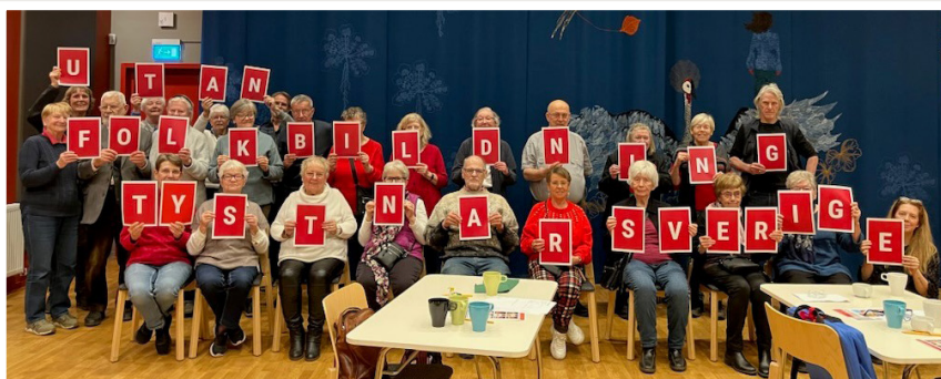
Cirkelledarträff på Kallhäll Folkets Hus

Med kampanjen ” Utan Folkbildning tystnar Sverige ” har vi under året lyft fram vad folkbildning faktiskt är – hur studiecirklar, samtal, kultur och gemenskap formar ett starkare demokratiskt samhälle. Vi var även representerade på Järvaveckan , för att synliggöra kampanjen men också folkbilda om folkbildning, för att synas, visa vad vi gör och hitta samverkansmöjligheter samt skapa nya kontakter.