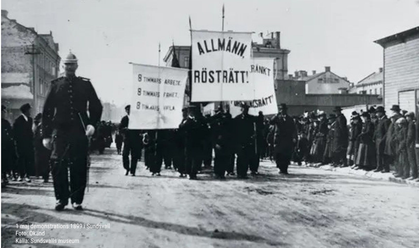
1 maj demonstrations 1899 i Sundsvall