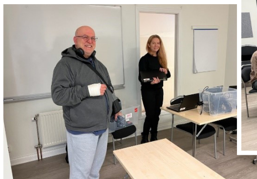
Förberedelser inför PRO Järfällas Datorkurs med ABF och ordförande PRO Barkarby/Skälby

ABFs lokal Fågelsången på Kvarnplan i Jakobsberg fungerar i stor utsträckning som en mötesplats. PRO Jakobsberg delar denna lokal med oss och har haft flera studiecirkel igång under året - datorcirkel, om mobil/surfplatta, körsång, engelska, samtalscirkel, föreningskunskap, res och läs, Samspel (som är ett band som utvecklats jättemycket under åren och de får numera spelningar på många ställen). Intressanta och bildande cirkel, föreläsningar och andra evenemang blandas med ABFs övriga föreningsverksamhet och projekt.