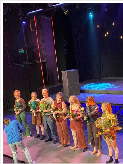
JaKan Cirkus/TEODOK

Att skapa tillsammans över åldersgränserna har varit en viktig del av Teodoks verksamhet och just så är det i "Kriget om källan". Premiär 21 mars 2026.