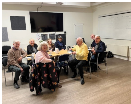
Mobilkurs med Seniornet på ABF i Jakobsberg