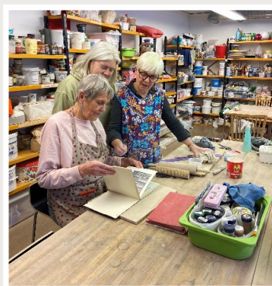
Ledarutveckling och julavslutning i Keramikverkstaden i Bro