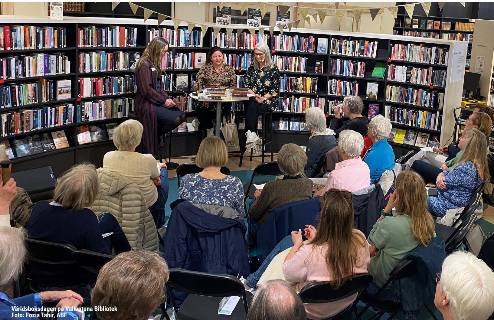
Världsboksdagen på Vallentuna Bibliotek