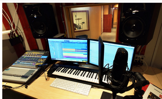
Podcaststudio och Musikstudio i Musikhuset på Kvarnplan i Jakobsberg.