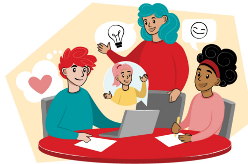
ILLUSTRATION: LOUISE HÄVEDAHL