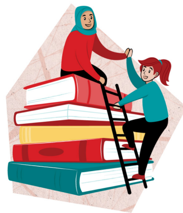
ILLUSTRATION: LOUISE HAVEDAHL

Riktlinjemål: ABF medverkar till jämlik och inkluderande omställning