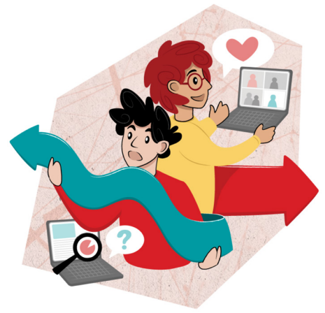
ILLUSTRATION: LOUISE HAVEDAHL

Riktlinjemål: Ett starkt ABF in i framtiden