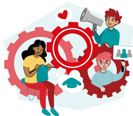
ILLUSTRATION: LOUISE HAVEDAHL